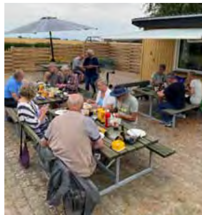
Grillaften i Dueslaget

Herefter serveres gratis gløgg og æbleskiver for medlemmer i Dueslaget.