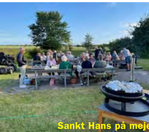
Sankt Hans på mejerigrunden