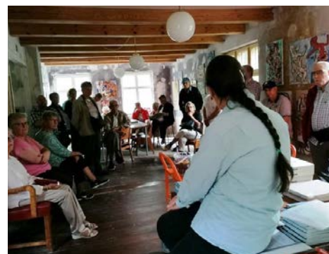
Vi har ører på stilke...!

Her er to næsten ens billeder af den glade flok, der drog på udflugt sammen og her har stillet sig op foran Richard Winthers Hus. Kan du se hvilke personer, der er til forskel på de to billeder? Skriv dit svar til præsten på laha@km.dk eller på en seddel i præstegårdens postkasse, så kan du vinde en hemmelig gave fra kirken. Husk at skrive dit navn og dine kontaktoplysninger på svaret! Det første rigtige svar løber med præmien – så skynd dig! (Deltagere fra turen kan ikke deltage!) Konkurrencen udløber 1. oktober 2019.