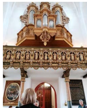
Orglet er fra Christian d. 4 tid og meget imponerende.