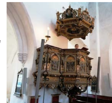
Til højre: En lille prædikant på 8 år